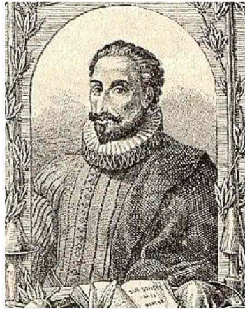
Cervantes, in lotta contro il plagio

Un atteggiamento «pirata» fu per esempio in Inghilterra la difesa della libertà di stampa contro la pretesa del