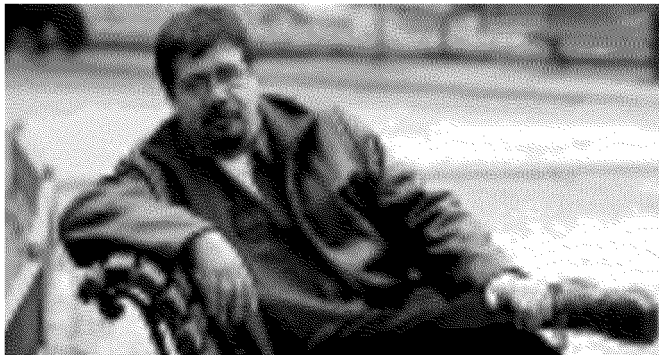
Lo scrittore Luis Sepulveda, ospite alla Scuola per librai alla Cini