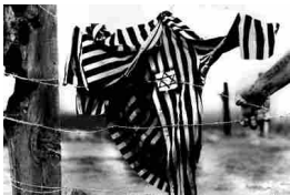
Memoria dello sterminio e sfida dell'oggi La lezione della shoah: «Non odiare mai»