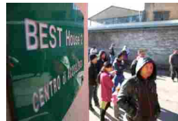
Reportage Rom, l'ultima vergogna Capitale Sette persone per stanza

Copyright 2015 © Avenire | P.Iva 00743840159 | Credits | Privacy | Per la pubblicità