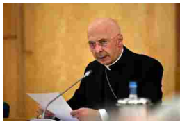
Consiglio permanente Bagnasco: «La crisi tormenta le famiglie»