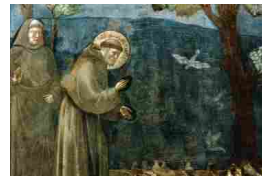
San Francesco e l'anello mancante