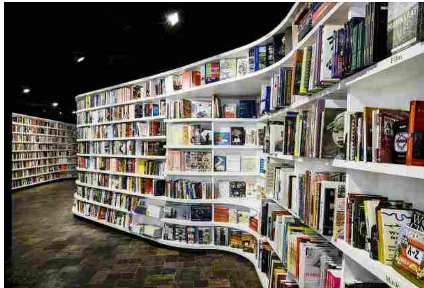
Librerie, ecco come le vogliono i lettori