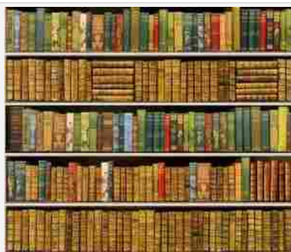
libri in libreria

Cala il mercato del libro di carta nel 2014 rispetto all'anno precedente, ma progressivamente meno. Cresce del 40% il mercato ebook – Il 2014 si chiude per i libri di carta con il segno meno nei canali trade, secondo i dati Nielsen: -3,8% il giro d'affari, -6,5% le copie vendute, in ripresa rispetto ai primi mesi dell'anno e anche rispetto agli anni precedenti. Il libro di carta si compra prima di tutto nelle librerie di catena (pesano per il 40,6%, anche se in leggero calo rispetto al 2013), un pochino meno nelle librerie indipendenti (al 30,7%), sempre più nelle librerie online, che oggi pesano il 13,8% (+ 8% rispetto al 2013). Diminuisce invece in modo significativo la grande distribuzione. Parallelemente il mercato degli ebook si stima al 4,4% del mercato del libro, con un fatturato di 51,7milioni di euro (+39,4% sul 2013).