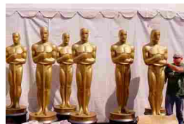
Cinema Nomination "bianche" agli Oscar? Ora si cambia