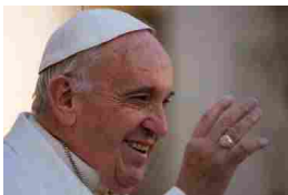
Discorso alla Rota Romana «Famiglia e unioni, non confondere»