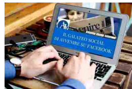
Poche regole per crescere insieme Il galateo social di Avvenire. Cos'è e perché è nato