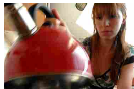
Il fenomeno Le casalinghe non si assicurano più