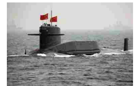
La corsa al riarmo Tornano i sommergibili: nuova guerra in mare

Copyright 2016 © Avvenire | P.Iva 00743840159 | Credits | Privacy | Per la pubblicità