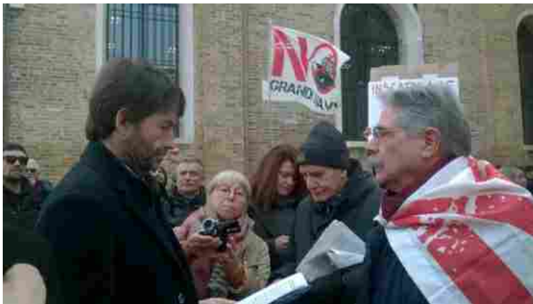
La consegna del dossier al ministro Franceschini

VENEZIA. Le nuove sale delle Gallerie dell'Accademia, la Scuola dei Librai alla Fondazione Cini, la Biennale. E il pranzo con il sindaco. Il ministro per i Beni culturali Dario Franceschini è tornato oggi, 29 gennaio, a Venezia. Lo aveva annunciato qualche giorno fa lo stesso Brugnaro, desideroso di spiegarli "a quattr'occhi", dopo le polemiche sui quadri e sulle navi, le richieste e le proposte sul turismo e la cultura a Venezia. Franceschini ha partecipato alle 11.30 all'inaugurazione delle nuove sale dell'Accademia. Occasione per visitare gli allestimenti e discutere con i vertici della cultura veneziana del prestito dei quadri, che Brugnaro aveva negato in un primo momento, per la prossima mostra italiana in Cina.