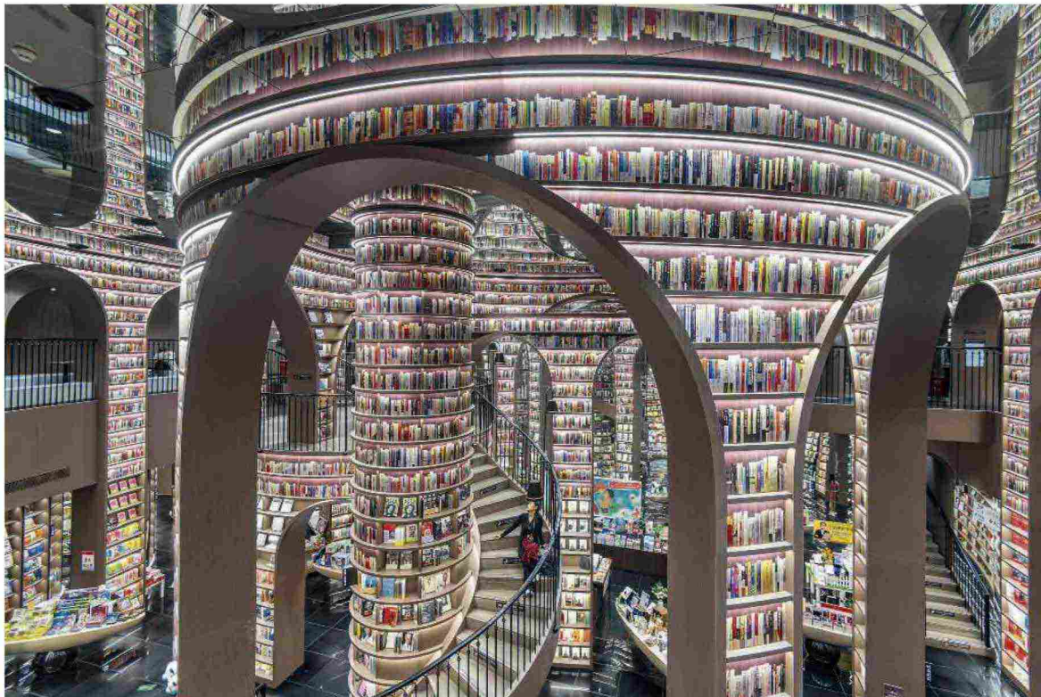
LABIRINTO DI CARTA La libreria principale della città cinese di Chengdu, in Sichuan.