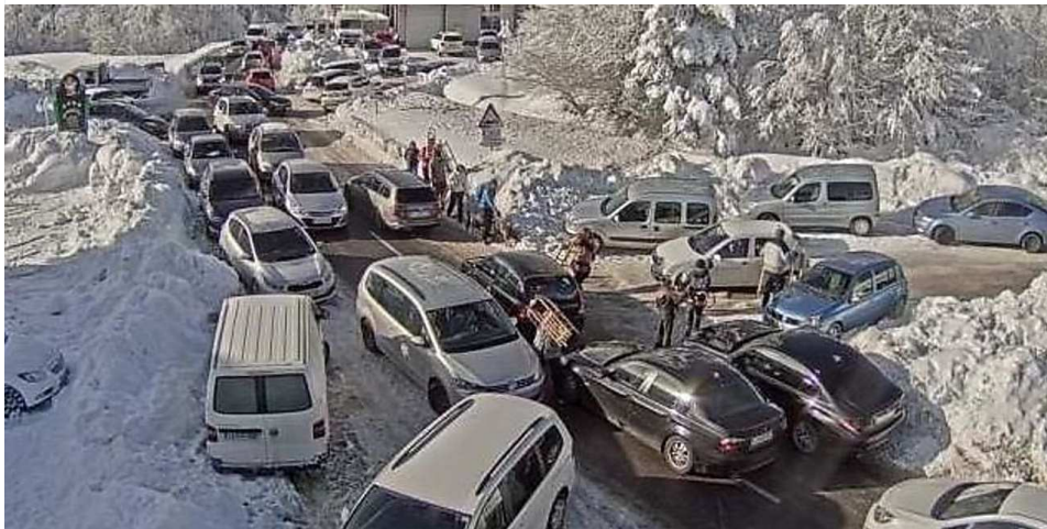
Slovenia, il grande ingorgo in montagna. E la polizia invita a non partire - cronaca - Il Piccolo