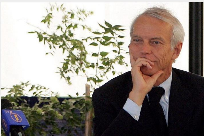
Riccardo Franco Levi

Il confronto con l'Europa. Il dato positivo italiano (+0,3%), esclusi e-book e audiolibri, è superiore a quello di Francia e Germania, che calano rispettivamente del -2% e del -2,3% e poco inferiore a quello spagnolo (+1%). Regno Unito (+5,5%), Olanda (+7%) e Finlandia (+2%) – tra i Paesi che ad oggi sono in grado di fornire questi dati – fanno significativamente meglio dell'Italia, mentre crolla il Portogallo (-19%). “I nostri dati erano in linea con Francia e Germania fino ad ottobre –, ha ricordato Levi – è stata l'apertura delle librerie durante l'ultimo lockdown a fare la differenza”.