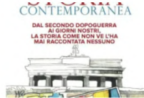
Con il Sole 24 Ore la collana INSTANT