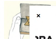
Il Gruppo 24 OF una serie di iniz per il Giorno de