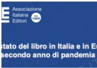
L'editoria di varia (romanzi e saggistica) cresce nel 2021 del 16%