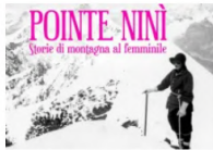
Su RaiplaySound il podcast dedicato a Nini Pietrasanta, un mito dell'alpinismo degli anni '30