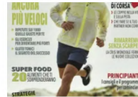
A Hearst Italia le licenze di Men's Health e Runner's World